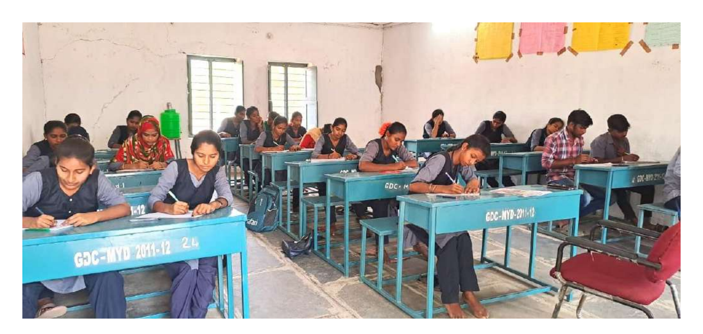
Essay Writing Competition on 28/02/2025