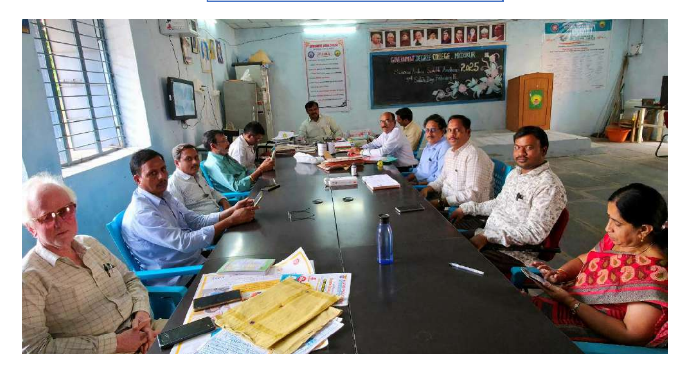
Staff Meeting on 22/02/2025

A teacher affects eternity; he can never tell where his influence stops,", "The art of teaching is the art of assisting discovery,", "What the teacher is, is more important than what he teaches,", "A good teacher can inspire hope, ignite the imagination, and instill a love of learning", and "Education is not the filling of a pail, but rather the lighting of a fire".