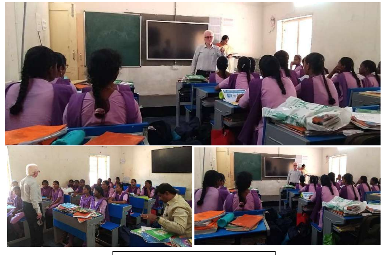
At KGBV, Chapadu on 14/02/2025