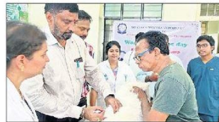
ప్రాధుటూరు : కుక్కకు టీకా వేస్తున్న

మైదుకూరు : పెంపుడు జంతువుల ద్వారా వ్యాధులు రాకుండా యజమానులు తగిన జాగ్రత్తలు తీసుకోవాలని మైదుకూరు ప్రభుత్వ డిగ్రీ