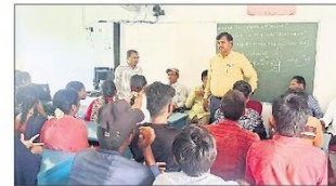
మైదుకూరు : కళాశాలలో మాట్లాడుతున్న

కలసపాడు : స్థానిక పశువైద్యశాలలో ప్రపంచ జూనోసిస్ డే సందర్భంగా కుక్కలు, పిల్లలకు పశు