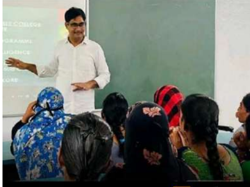
వైస్ఆర్ కడప జిల్లా వార్తలు. వే2న్యూస్. డాన్లడ్ way2news way2.co/2bgy2x

Date: 13/09/2024, Edition: YSR Kadapa (Proddatur), Page: 9 Source : https://epaperapp.sakshi.com/