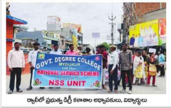
ర్యాలీలో ప్రభుత్వ డిగ్రీ కళాశాల అధ్యాపకులు, విద్యార్థులు