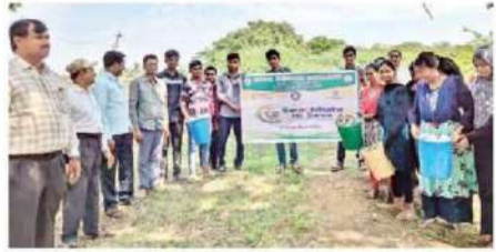
ప్లాస్టిక్ వ్యర్థాలను సేకరిస్తున్న కళాశాల విద్యార్థులు