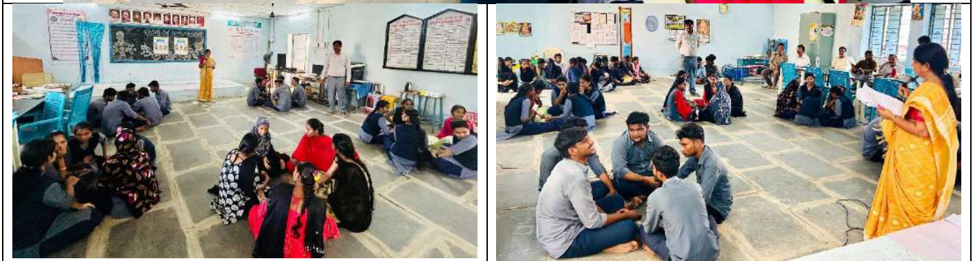
Quiz Competition on 30 th September, 2024