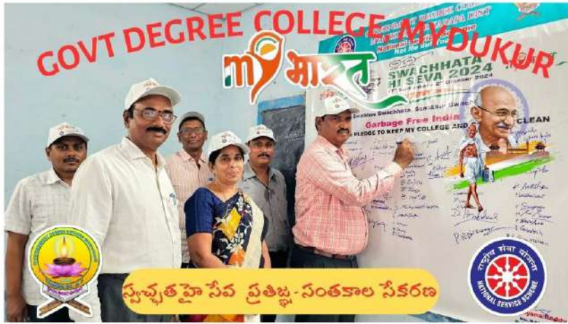
స్వచ్ఛత హై సేవ ప్రతిజ్ఞ-సంతకాల సేకరణ